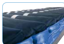
18 cellules en PU/Polyamide indépendantes. Nappe et cellules amovibles.