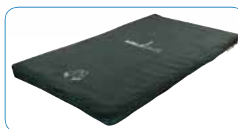
Disponible en matelas grande largeur pour lit médical en 120 cm.