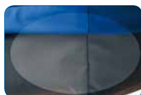
Face inférieure en textile anti-dérapant.

Interrupteur avec voyant lumineux. Potentiomètre d'ajustement du niveau de gonflage.