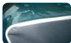
Face inférieure en textile anti-dérapant amovible.