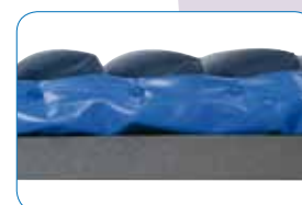
Maintien latéral des cellules.