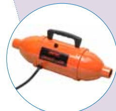
Pompe de gonflage rapide

Bouchon d'obturation du tuyau d'alimentation avec équilibre des pressions en mode transport