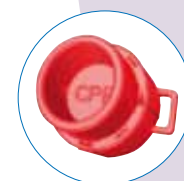
Nouvelle vanne CPR (Cardio Pulmonary Rescue)